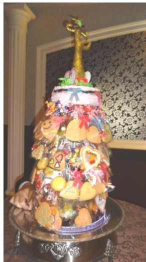
皆で作ったクッキータワーです。